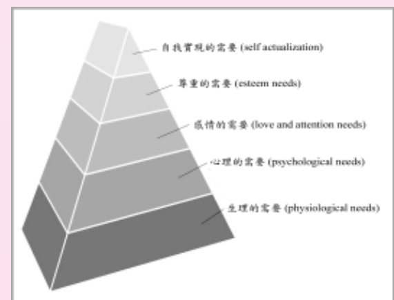
馬斯洛提出人生的五種需要

這一層，稱為尊重的需要 (esteem needs)。他需要別人對他的尊重，因為人是羣體的動物；但另一方面他又保留他自己，於是形成非常複雜的關係。所謂人情世故，這是最難學的。因為人人要求不同，你如何尊重他？中國人俗語中所謂「面子」，你若把他的面子丟去，他便不能在這個世界中生存了。人要覺得被尊重，這是人的「自我」(ego)，那是自我的本能，要人家承認自己存在的價值。西方存在主義在這方面大加發揮，人要自己抉擇，不要做一個被人決定的人。把這個意思先發揮出來的便是尼采，他提出主人的道德和奴隸的道德：人應該自己立法，甚至不須通過上帝。尼采要做超人 (superman)，要做立法者，「法」不是規章，更是價值的重估，他要重估一切價值，而標準由我來訂。但是這樣做的話，很容易使人走上獨裁者的角色，所以尊重的需要很容易變成權力的需要 (power needs)。馬斯洛沒有指出這一點，但這一點才更能顯示人的問題。歷史從中國文化的角度來說，人要求別人對自己的尊重其實是來自於人的自愛與自重，但若源頭不清，便很容易虛假。中國舊社會中特別多偽君子，在某一角度看來，正是這種要別人尊重自己，即是造成要面子的扭曲。