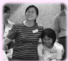
孩子進步 家長開心

今年暑期，五十八位年青人參加了由法住機構主辦、於肇慶抱綠山莊舉行的第二屆（七月廿五日至八月一日）、第三屆（八月八至十五日）「明日領袖鍛煉營」。通過連串精心設計的鍛煉，年青人的眼界與胸襟得以開發、提升，並真真切切的感受自己、感受生命力；短短八天的鍛煉營，就激發了年青人的志氣！他們的性情得到開發，學會自己要求自己、克服自己的障礙；在抱綠山莊的自然懷抱中，感受到人與大自然的和諧、也感受到天地不斷給予自己無聲的支持；通過古聖賢的事蹟，心中悠然生起對偉大人格的嚮往之情。