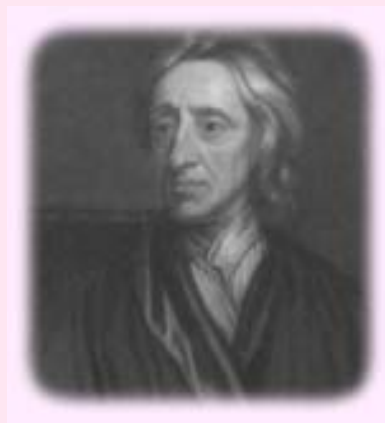
洛克(John Locke, 1632-1704)

所以，英國的經驗主義出來，駁斥歐陸哲學的理性主義，首先是洛克(John Locke, 1632-1704)，然後是巴克萊(G. Berkeley, 1685-1753)，接著是休謨(David Hume, 1711-1776)。經驗主義者認為知識不是起源於理性，而是起源於經驗。他們不是要否認理性，但知識的起點卻不是在理性，而是經驗。洛克對經驗的認知活動進行分析：我們通過感性與外在世界接觸，首先得回來的是感覺(sensation)，例如色、聲、香、味、觸，稱為「第二性」(secondary quality, 又譯「次性」)，但次性不是獨立自存的東西，並不就是事物之自身；由色、聲、香、味、觸所組成的主觀感覺，其實是事物本身所具有的客觀性質，作用於感官之上而產生的東西。事物本身所具有的客觀性質，稱為「第一性」(primary quality, 又譯「初性」)，包括形象、數量、外延、速度等。