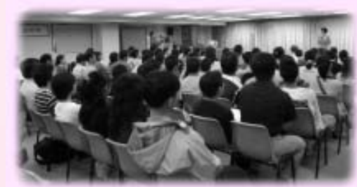
家長踴躍上台分享

經歷了「明日領袖營」的鍛煉，青少年都各自有所進步，有所成長，父母家長都感到安慰。