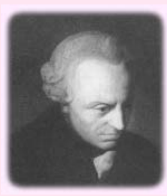
康德(Immanuel Kant, 1724-1804)

「簡單觀念」(simple idea)；然後再通過理性思考，將各個簡單的觀念再組合成一個「複合觀念」(complex ideas)，例如紅玫瑰。知識就是如此產生。換言之，知識的源頭是經驗，理性思考是認知過程中對簡單觀念的後期處理。