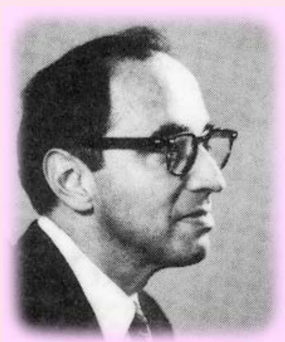
孔恩(Thomas S. Kuhn)

波普爾之後，在六十年代有孔恩(Thomas S. Kuhn)的批判。孔恩在他的名著《科學革命的結構》(The Structure of Scientific Revolutions)提出新的科學革命理論，強調科學不斷地向前，不斷地突破，其中起關鍵作用的是「範式轉型」：由於範式轉型了，所以我們對科學的理解也不同了。他的說法引起許多堅信科學是客觀真理的學者反對，認為他混淆了科學的與非科學的界線，把科學變成相對主義的知識觀，