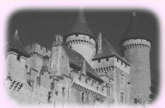
科學知識，就如一個城堡。

準則，其標準在「理性」。這就是替科學與非科學下了最早的界線。邏輯實證論不過是在這基礎上確認科學知識的領域，即以「可檢證性」為限。而波普爾則進一步提出「可否證性」或「可證偽性」才是科學知識的特殊身份，從而替科學與非科學劃界。從巴斯卡到波普爾，都是要把科學知識放在經驗的平台上考量，雖然孔恩指出科學知識的發展與歸納無關；今天被認為是反例的，轉換角度之後，反例可能得到解決。不過，這仍然沒有改變科學知識的經驗立場，所以科學知識的真正問題在經驗的局限：我們永遠不能從有限的經驗領域中解答超經驗的問題。有關上面所舉的宇宙起源問題、精神起源問題、宇宙秩序問題等等，無論科學如何進步，觀察工具如何精確，都是永遠解答不到的。理由是這些問題已經超出科學方法所能處理的範圍，這是無法超越的局限。科學只能通向知識之路，但不是「真理」(絕對真理、永遠真實) 之路，更不是到達宇宙本源之路。所以，縱使科學再進步，但它只能回答可以回答的東西，無法回答的始終不能回答。