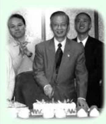
祝賀老師松柏長青