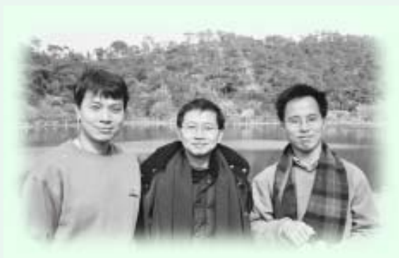
作者(中)與同學攝於讀書營

子百家、二十五史、詩詞歌賦，乃至堅實的文獻學、文字學等訓練，自付今後要加倍努力打好做學問的基礎。