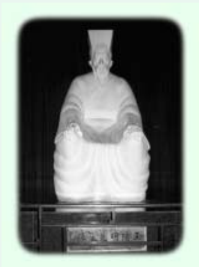
陽明祠中的陽明像

儒家的學問是關注人成德、成聖的問題，用業師霍韜晦教授的話就是「生命成長」的問題 [1] 。「生命成長」就是生命不是只得一個平面，而是立體的，有不同層次的，例如有生物的層次、有心理的層次、乃至有道德人格的層次。生命要成長就要透過行動、實踐去體會、去感受道理的真實，並在生命的層級上不斷超升，以生命作見證。