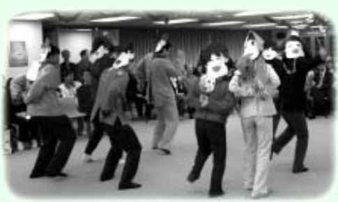
香港同學渾身解數表達對老師之情

三月六日，老師的笑容很燦爛，這天是法住同學熱切期待的一天；因為，這一天是我們的「感師日」。