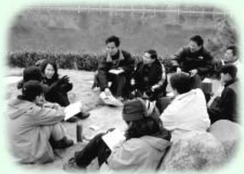
學長、學弟、學妹在湖邊互相勉勵

這一切當從治學的態度開始。說態度，單是「治學態度嚴謹」等濫調不能勾勒出諸先生治學的心靈，他們直是把整個生命投放在學問世界去。在他們身上，使我感受到從前讀書人的認真、刻苦、胸襟、氣度、對民族文化刻骨銘心的感情；文化、學問與自身生命結成共命人，個人的生命早已流入文化的生命大流去。