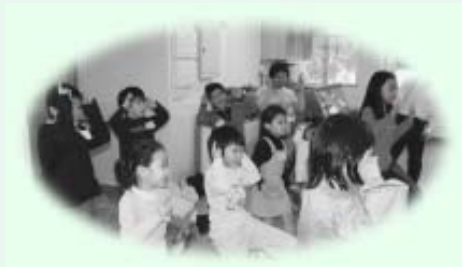
跳蹦蹦的「小生命」，耍出可愛的兔形拳。

首先大家來個熱身操。同學、義工們穿插在公公婆婆當中，與他們一起做伸展運動。跟著「小生命」出場，認真地背誦朱熹〈春日〉詩，朗朗上口，聲聲鏗鏘。接著「小生命」獻唱兒歌「別做大懶蟲」，透過愉快的歌聲、活