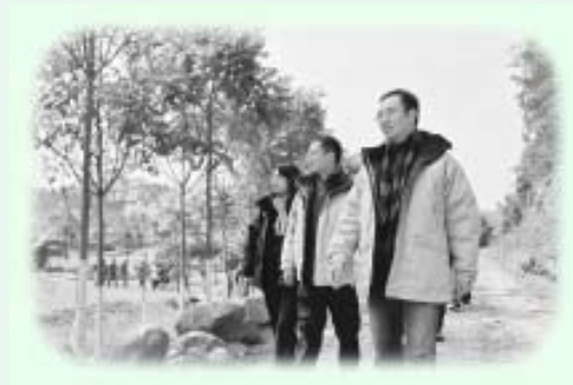
同道同心，上路也特別從容

能與四十多位同學、同道在山明水秀的抱綠山莊一同放開平日的事務，專心一致地讀書，本已是美事，何況能一起激發情志、互相勉勵？幾天以來，看見同道求學的熱忱，真的高興不已。更難得的是能目睹老師對各同學的指點，不但大開眼界，對老師的因材施教，化生活問題為學術、化學術問題為生命的追求，更是歎為觀止。這不但使我對寬廣的學術世界及深不能測的生命內蘊多了幾分見識，更感受到同道同心的情志。