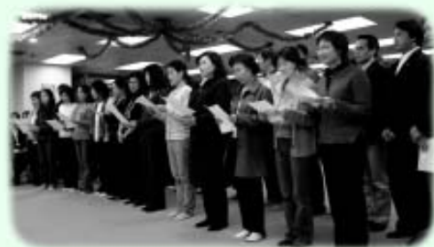
「喜耀」合唱團唱出同學的心底話

祝壽會後，大夥兒到飯堂享用各款美食，每位同學更獲贈一雙紅雞蛋！這天，師生之情、師友之義、對理想嚮往與貞定之情，瀰漫四週，令人感動。