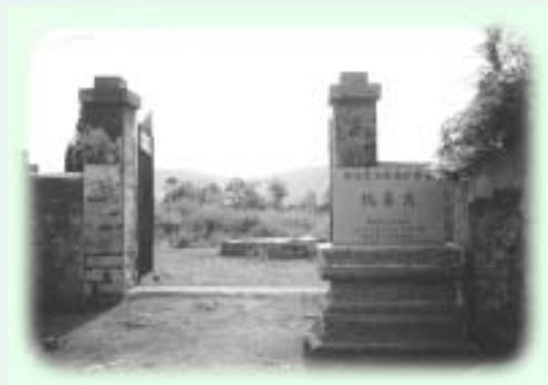
陽明先生於「玩易窩」開悟

[4] 於是「日夜端居靜默，以求靜一，久之胸中灑灑，而從者皆病。」 [5] 陽明此時之「俟命」，是表示將現實中的一切，全部放棄。不但得失榮辱不在念中，連自己生死的「意志」亦予以否定。久之，「因念聖人處此，更有何道？」 [6] 忽中夜大悟。原來生死關就是悟道關，人的頓悟是從人內心很深的地方生出來的。正因為外面甚麼都沒有，只有你自己，如果自己的力量生不出來，生命就會倒下。不能生即死，不能死即生。就在這一念間，他突然明白格物致知的精神在那裡，就在「聖人之道，吾性自足」 [7] ，何須外求？成聖在己，過關也在自己，人能頓悟，就在這裡，所以「吾性自足，向之求理於事物者，誤也。」 [8]